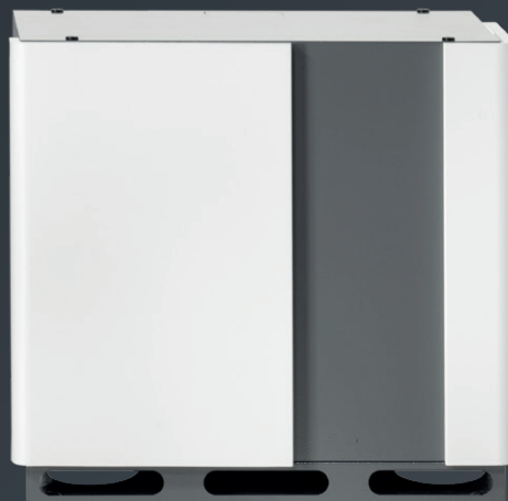
S10 SE BATTERIEFACH